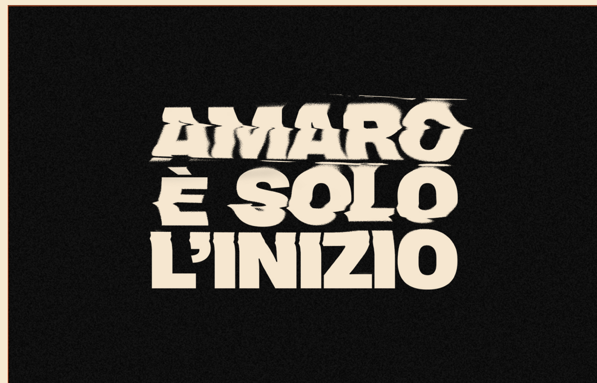
LINE DI CAMPAGNA DISTORTA