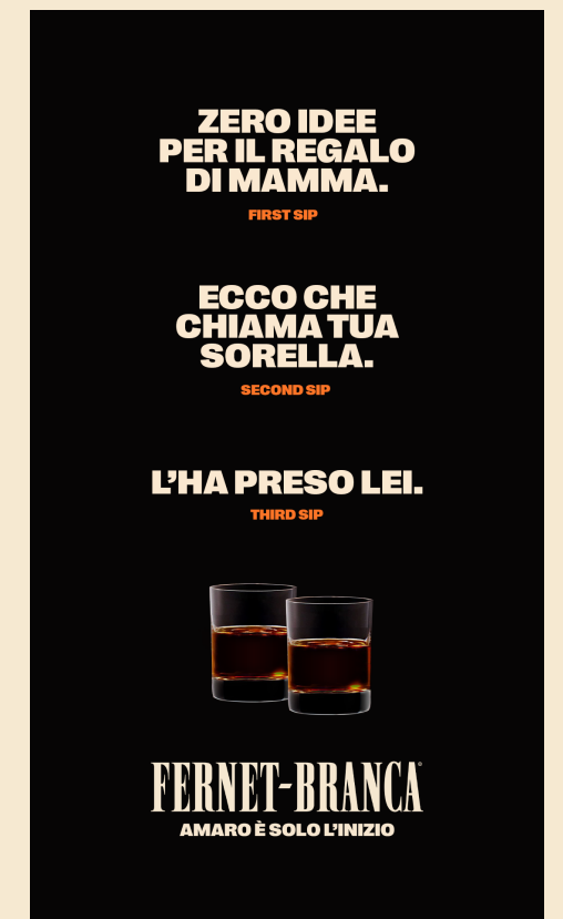
LOGO TAGLINE LOCKUP