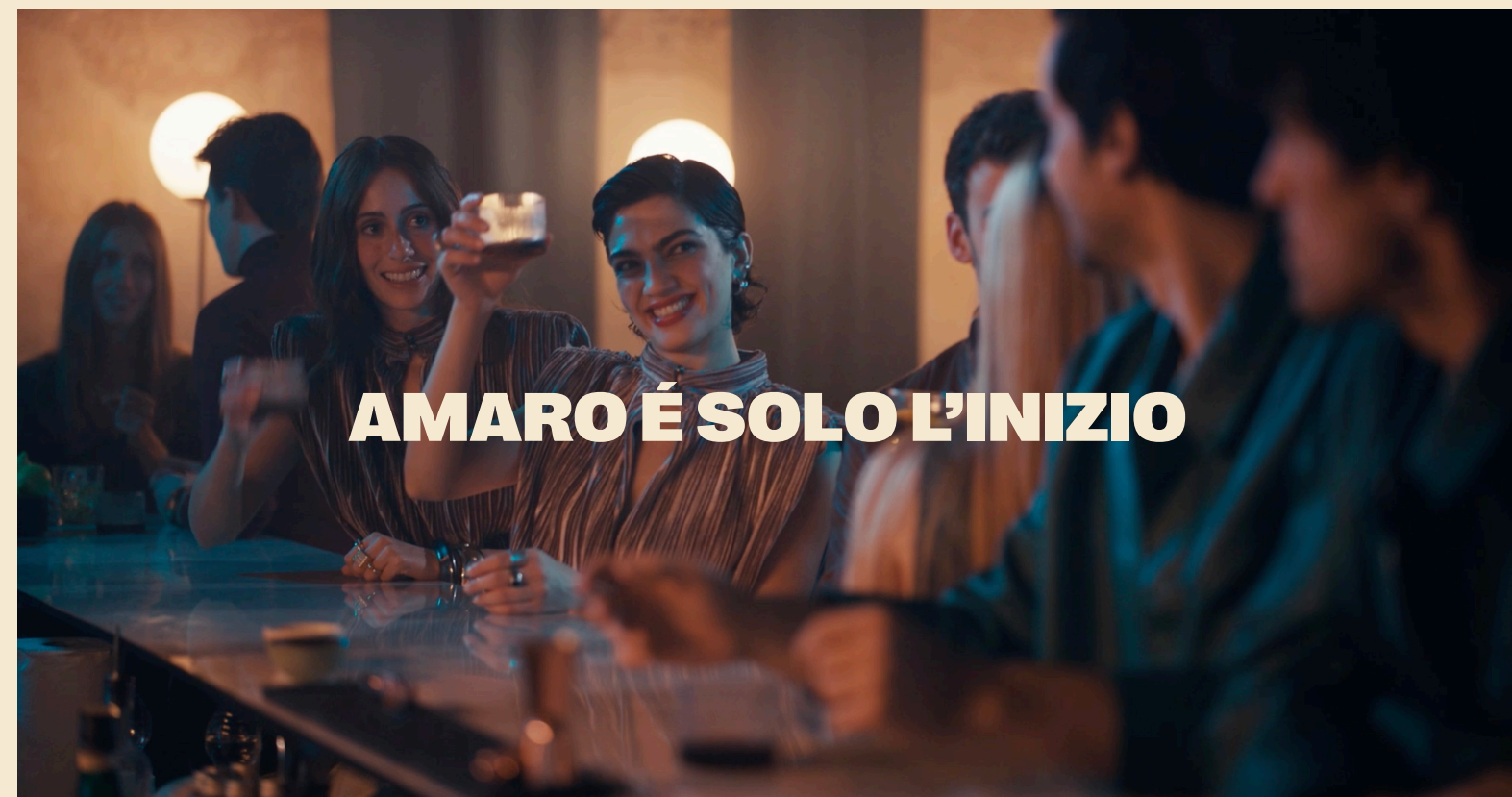
LINE SEMPLICE 16:9