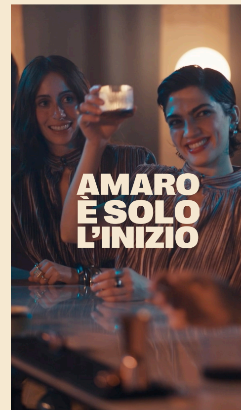
LINE SEMPLICE 9:16