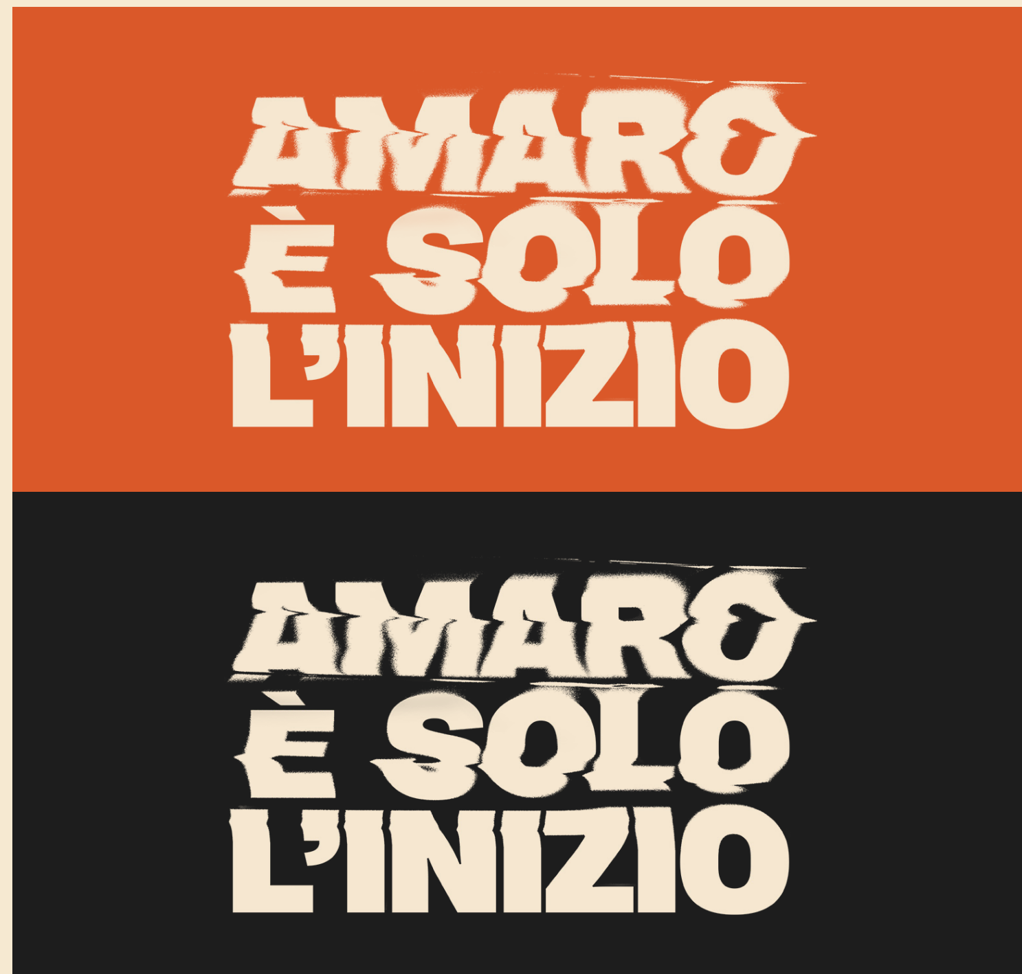
LINE DI CAMPAGNA DISTORTA