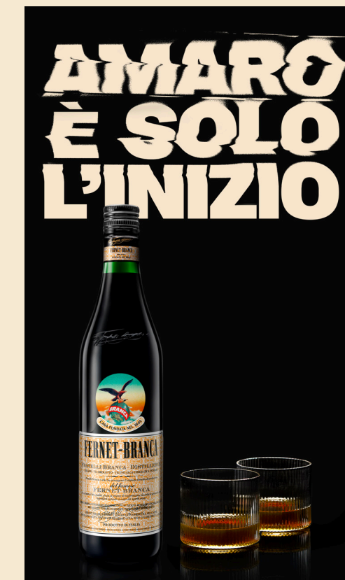
KEY VISUAL 9:16