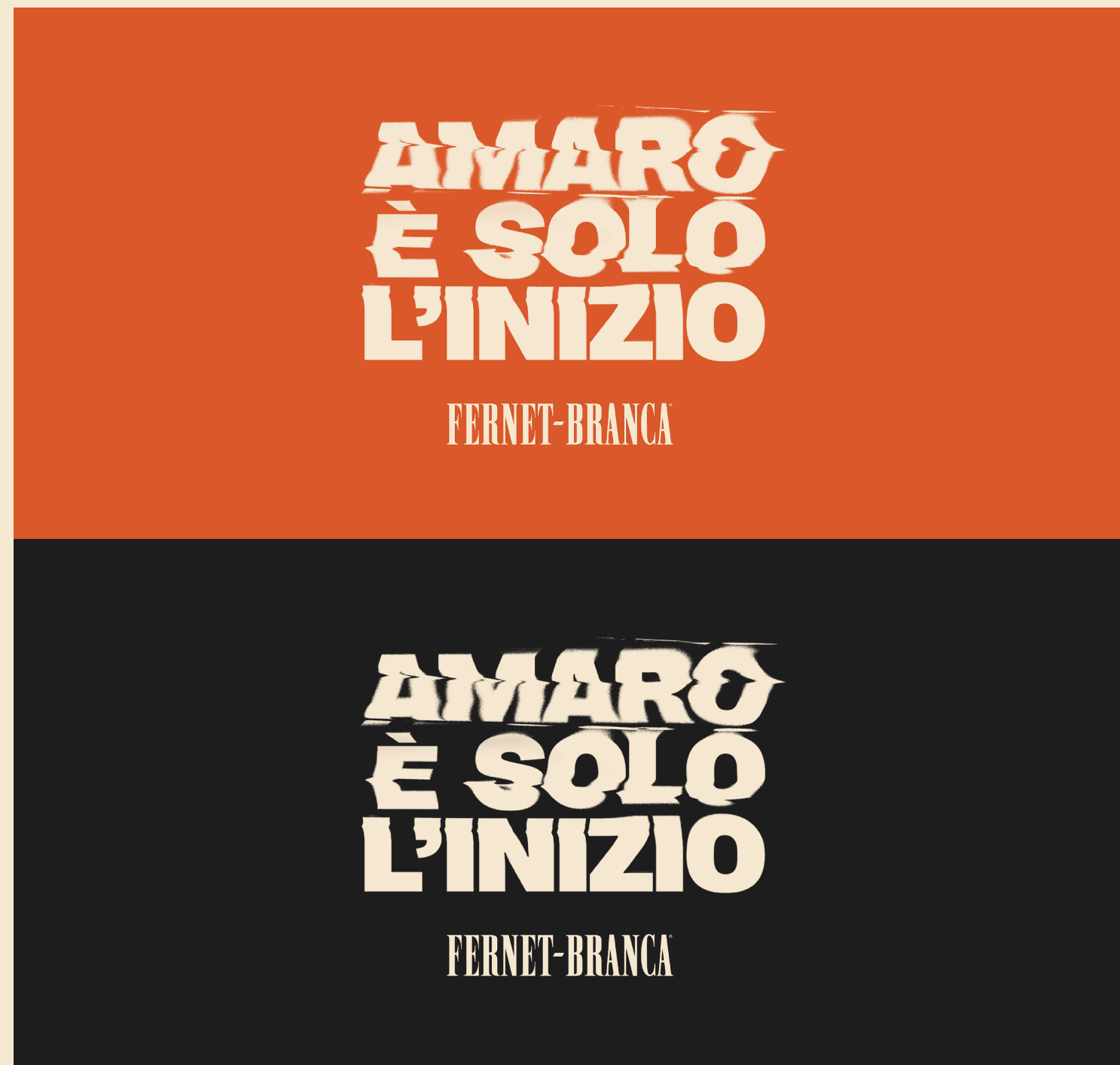
LINE DI CAMPAGNA DISTORTA