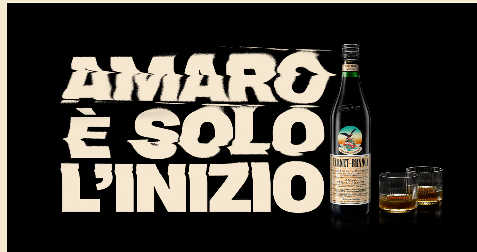
KEY VISUAL 16:9