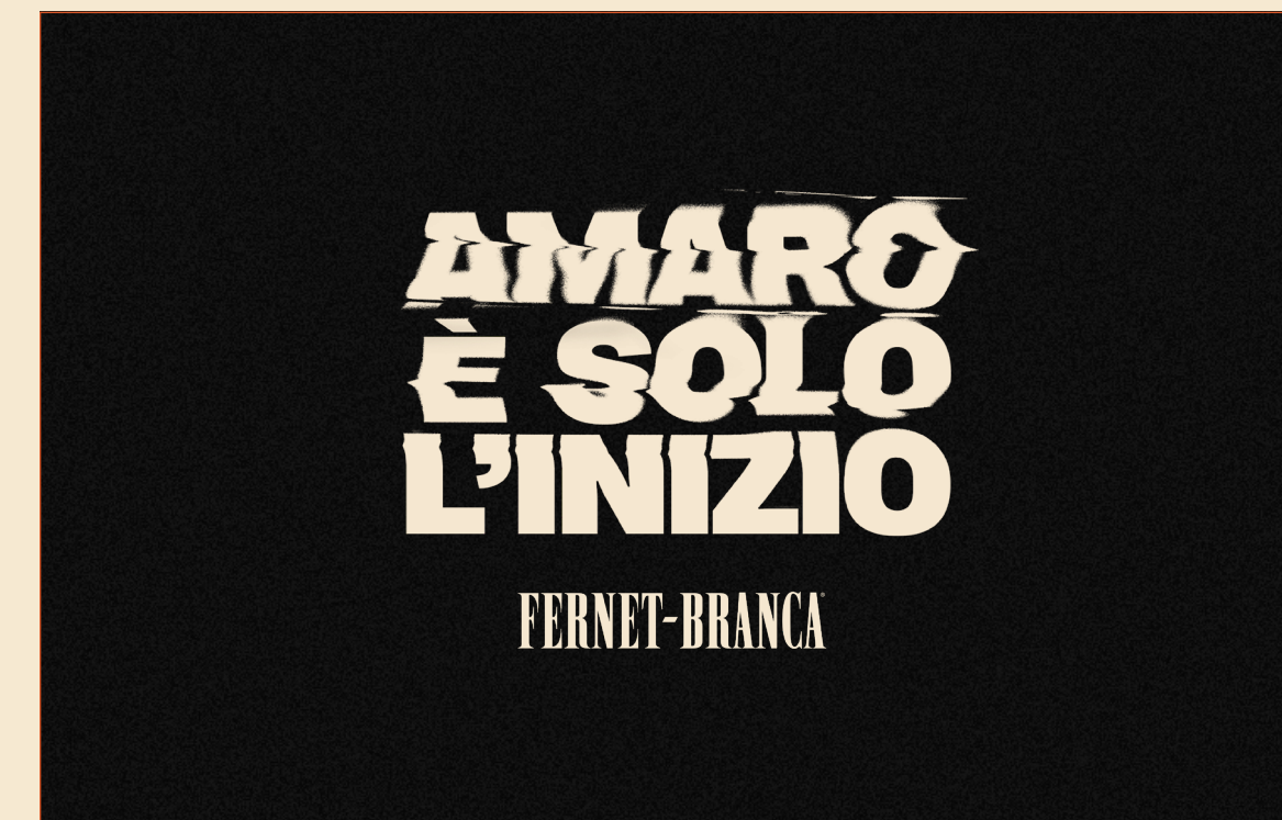
LINE DISTORTA + LOGO