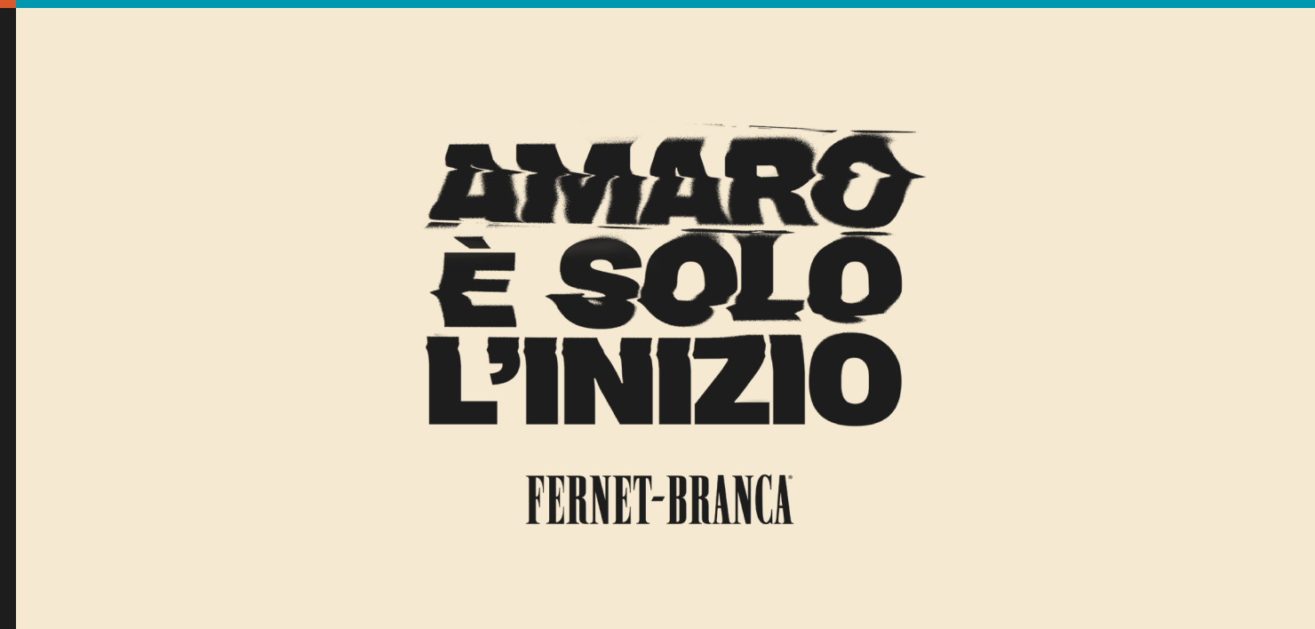
LOGO + TAGLINE