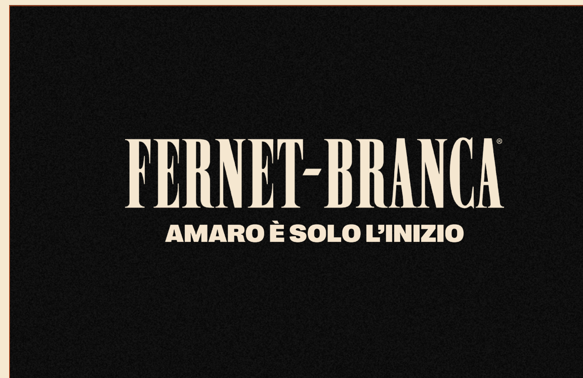
LOGO + TAGLINE LOCKUP